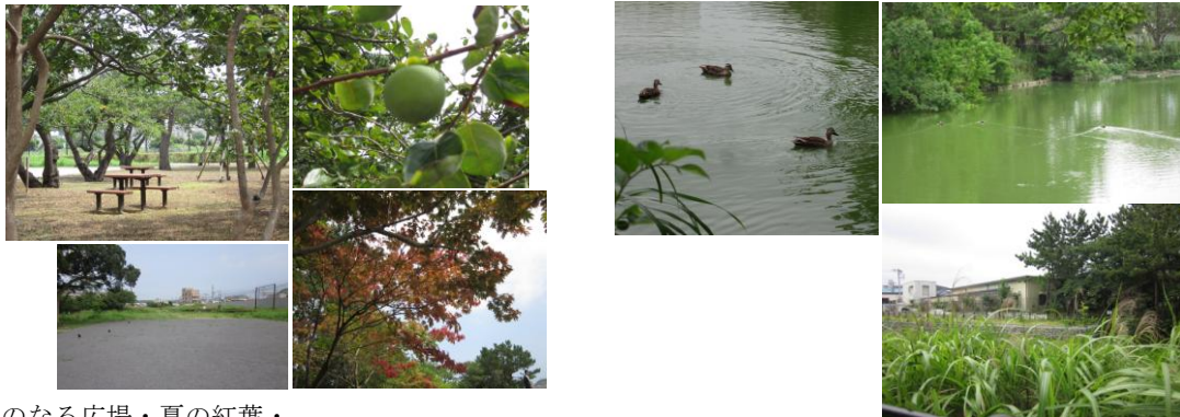
<実のなる広場・夏の紅葉・