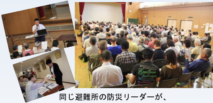
同じ避難所の防災リーダーが、顔を合わせる良い機会にもなりました。

マニュアル完成に伴い、まずは町内会・自治会役員を始め民生委員など、震災時に中心になって活躍される方を対象に、久里浜コミュニティセンター集客室にて、7月5日（日）に説明会を行いました。